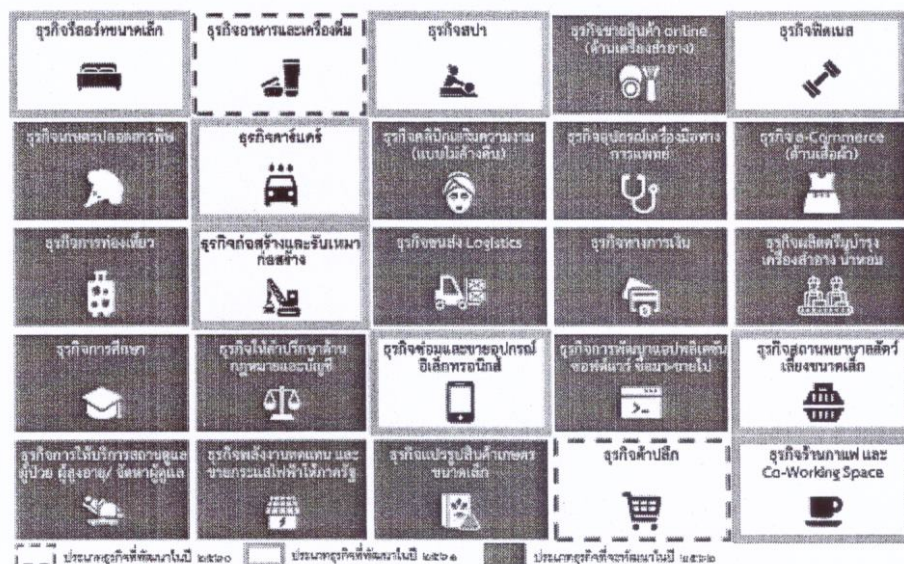
แผนภาพที่ ๑ แผนการดำเนินการพัฒนาระบบการให้บริการภาครัฐแบบเบ็ดเสร็จทางอิเล็กทรอนิกส์ (Biz Portal) เพื่อให้บริการแบบเชื่อมโยงครบวงจรใน ๒๕ ประเภทธุรกิจที่สำคัญ

โดยในปีงบประมาณ พ.ศ. ๒๕๖๒ จะดำเนินการพัฒนาระบบเพื่อให้บริการเพิ่มเติมในเขตกรุงเทพมหานคร จำนวน ๑๕ ประเภทธุรกิจ ได้แก่ ธุรกิจผลิตครีมบำรุง เครื่องสำอาง น้ำหอม ธุรกิจคลินิกเสริมความงาม (แบบไม่ค้างคืน) ธุรกิจการให้บริการสถานดูแลผู้ป่วย ผู้สูงอายุ/จัดหาผู้ดูแล ธุรกิจพลังงานทดแทน และขายกระแสไฟฟ้าภาครัฐ ธุรกิจการท่องเที่ยว ธุรกิจให้คำปรึกษาด้านกฎหมายและบัญชี ธุรกิจการพัฒนาแอปพลิเคชัน ซอฟต์แวร์ ชื้อมา – ขายไป ธุรกิจเกษตรปลอดสารพิษ ธุรกิจทางการเงิน ธุรกิจการศึกษา ธุรกิจขายสินค้าออนไลน์ (ด้านเครื่องสำอาง) ธุรกิจ e-Commerce (ด้านเสื้อผ้า) ธุรกิจแปรรูปสินค้าเกษตรขนาดเล็ก ธุรกิจอุปกรณ์เครื่องมือทางการแพทย์ และธุรกิจขนส่ง Logistics รวมจำนวน ๓๐ ใบอนุญาต ครอบคลุมการขออนุญาตรายใหม่ การต่ออายุ การแก้ไข/เปลี่ยนแปลง และการยกเลิก รวมถึงการพัฒนาระบบให้สามารถเชื่อมโยงระบบการรับชำระเงินกลางของบริการภาครัฐ (e-Payment Portal of Government)