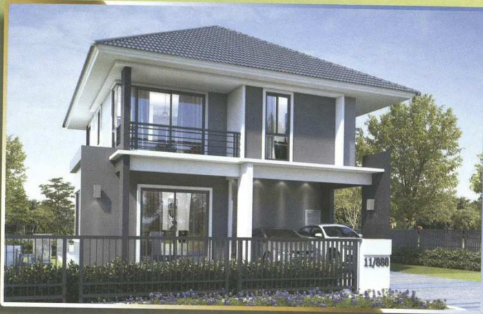
บ้านเดี่ยว 2 ชั้น ขนาดที่ดิน เริ่มต้น 80.00 ตร.ว.