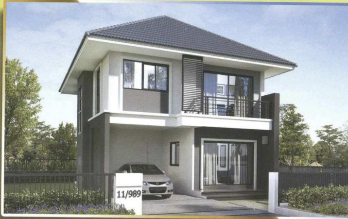
บ้านเดี่ยว 2 ชั้น ขนาดที่ดิน เริ่มต้น 70.00 ตร.ว.