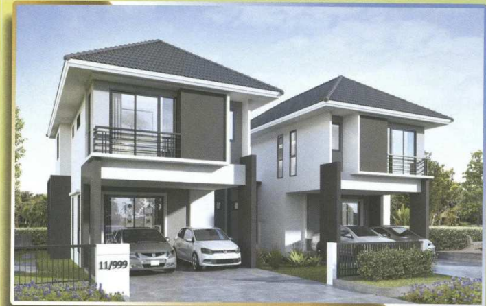
บ้านแฝด 2 ชั้น ขนาดที่ดิน เริ่มต้น 52.50 ตร.ว.