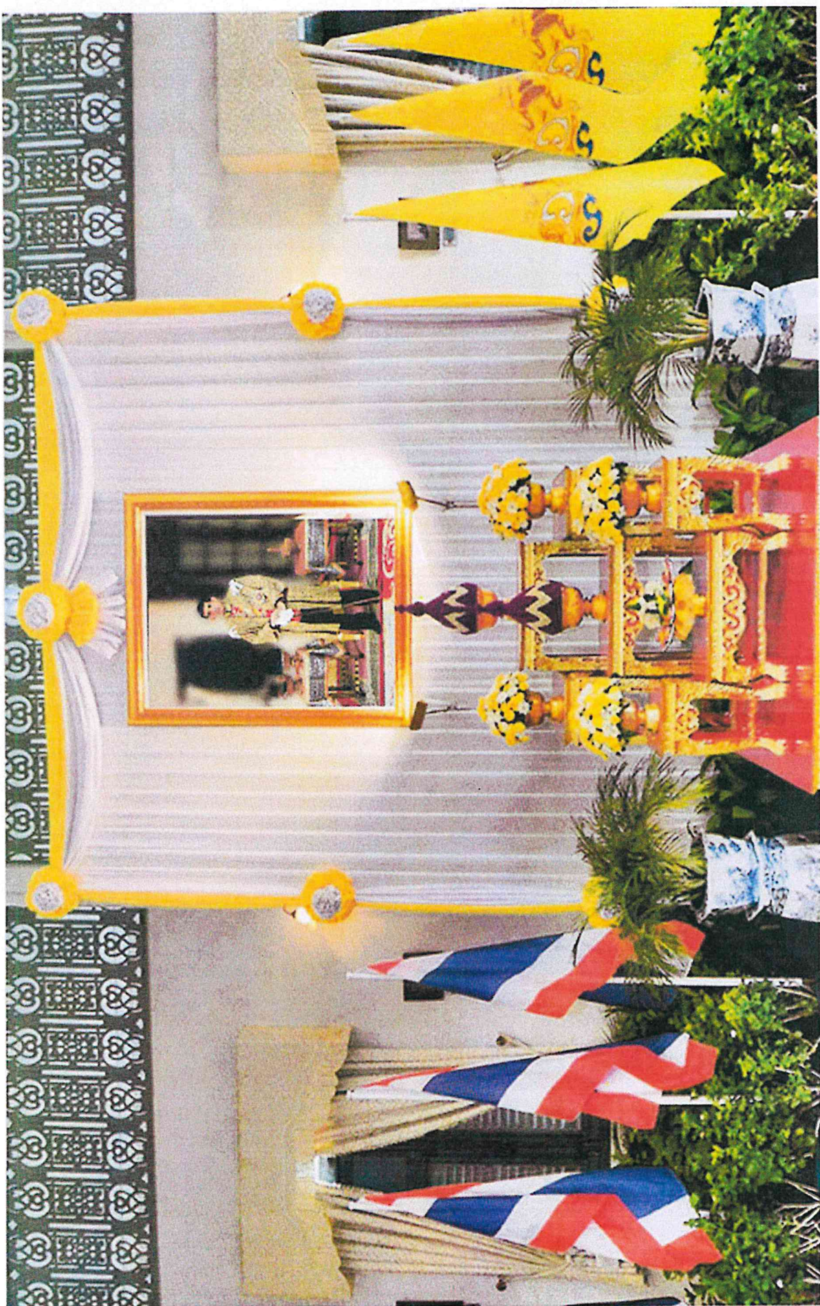
ตัวอย่างการจัดสถานที่ลงนามถวายพระพร